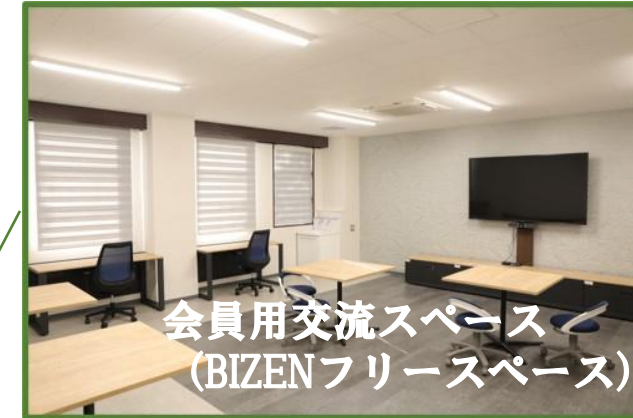
会員用交流スペース (BIZEN フリースペース)