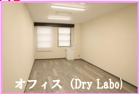
オフィス (Dry Labo)