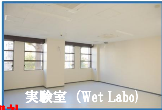
実験室 (Wet Labo)